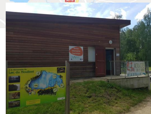
Point de départ