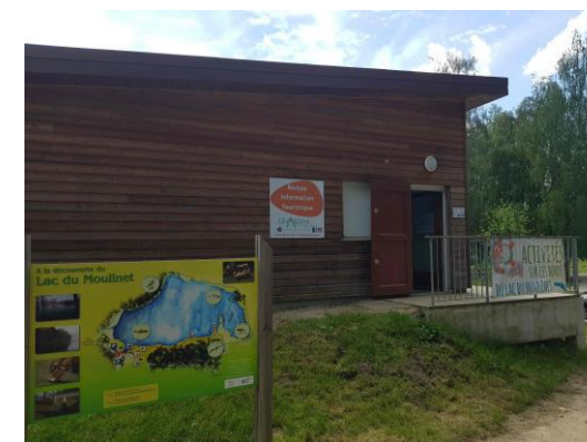
Point de départ