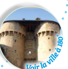
Voir la ville à 180° Porte du Soubeyran, du XIV e siècle puis rénové au XVII e