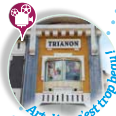
Art déco, c'est trop beau ! CINÉMA LE TRIANON