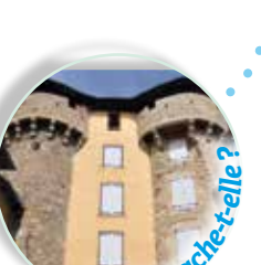
Où se cache-t-elle ? Porte du Théron, monument du XIV e siècle, rénové au XVII e .