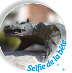
Selfie de la bête 1958 - Statue de la bête du Gévaudan (Auricoste, sculpteur) Place des Cordeliers

GÉVAUDAN AUTHENTIQUE Office de Tourisme et de Commerce et de la Culture Gévaudan Destination