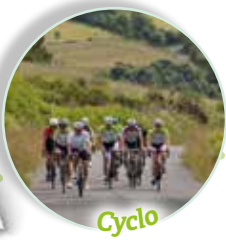
Cyclo Amateurs de cyclo, notre destination se dévoilera à vous au travers de 8 itinéraires, conçus et conseillés par le Cyclo Club Marvejolois et les Mordus de la Petite Reine.