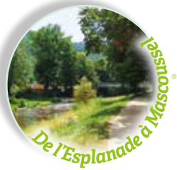
De l'Esplanade à Mascoussel Baladez-vous le long de la Colagne, pour rejoindre la plaine de jeu de Mascoussel