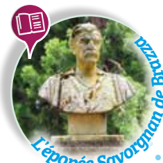
L'épopée Savoyennan de Retrouvez son buste et son exposition.