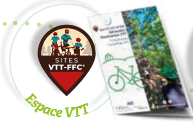
Espace VTT 4 circuits au départ de Mascoussel de 9 à 46 km