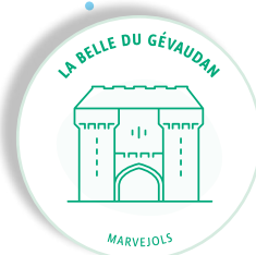
LA BELLE DU GÉVAUDAN MARVEJOLS