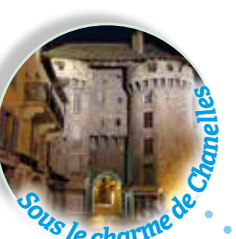
Sous le charme de Chanelles Porte Chanelles, monument du XIV e siècle, rénové au XVII e .