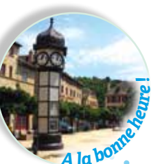
A la bonne heure ! 1889 - Horloge-kiosque (Coutençon, fondeur) Place Henri Cordesse